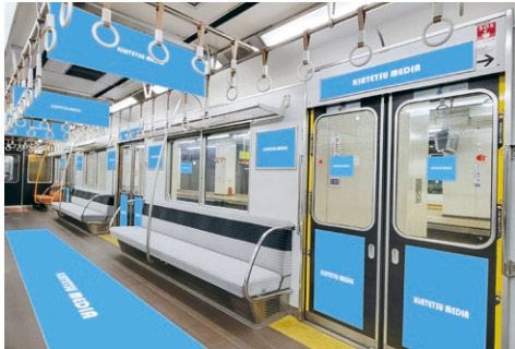
※イメージ (選定車両により異なります。)

近鉄車両を、車体外観と車内のポスター・ステッカー・フロアまで、1編成をまるごとジャックする特別企画商品です。商品やブランドイメージが体感できる圧倒的な展開が可能です。