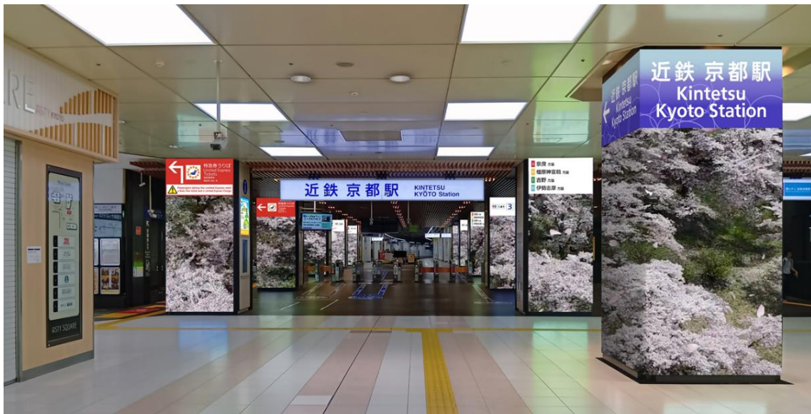
(画像はイメージです)