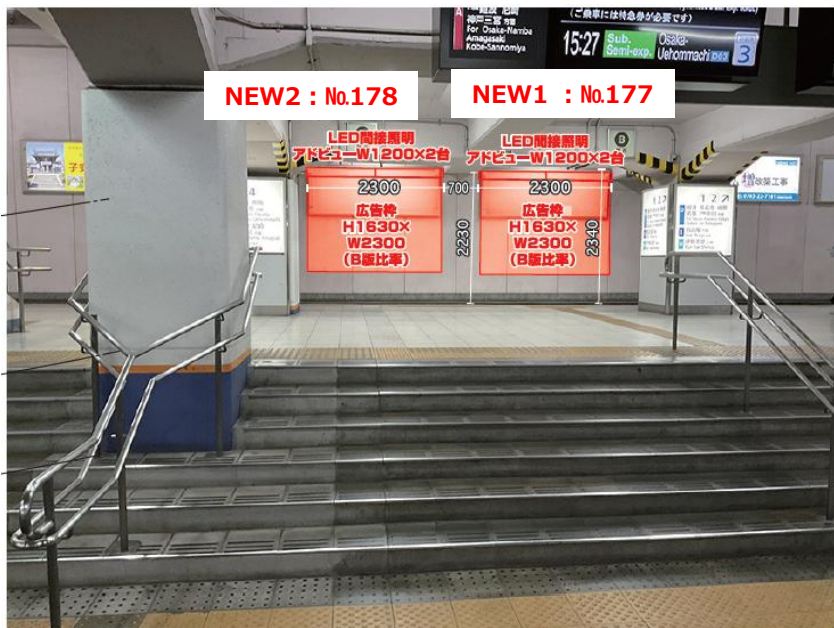
大和八木駅 6番ホーム